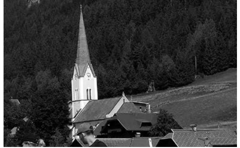
Die evangelische Kirche in Techendorf ist hier die größte Kirche im Ort.

Wir waren eine ausgesprochen interessierte und fröhliche Gruppe, die sich untereinander ausgezeichnet