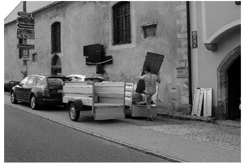
Ein Anhänger nach dem anderen wird beladen

ken über einige Themen machen: wie kann aus dieser alten Kirche eine moderne Kirche zum Feiern der Liebe Gottes werden? Was ist für uns wichtig, und was brauchen wir? Was sagt der Kirchenraum über die Menschen, die da feiern? Wie kann eine sinnvolle Verbindung von Altem und Neuem geschehen? Soll der Raum über der Sakristei nutzbar gemacht werden? Und was sagt das Bundesdenkmalamt zu unseren Plänen?