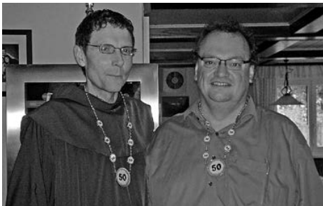
Zusammen 100 Jahre jung