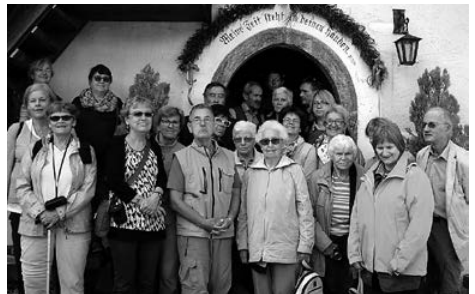
Vor der Georgskirche in Altersberg