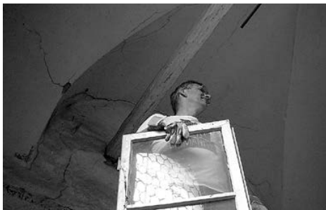
Da findet man Sachen

Wir wollen die geschenkte Zeit nutzen und uns intensive Gedan-