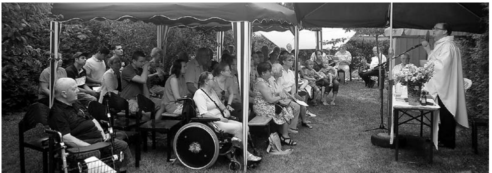
Gemeindefest im Juni – das Wetter hielt aus