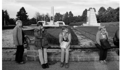
Aufmerksame Zuhörerinnen in der Gedenkstätte Mauthausen