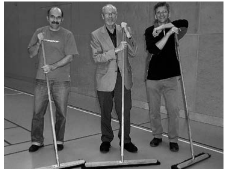
Miteinander putzen – gemeinsam geht's besser