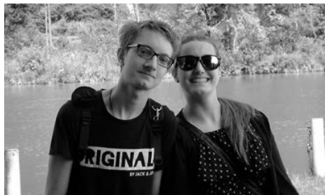
Kurze Rast an der Enns

ben wir den Nachmittag bei einer guten Brettljause ausklingen. S. K.