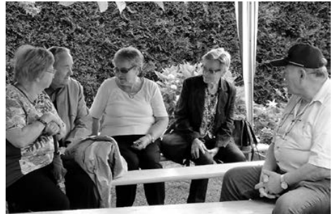
Beim angeregten Gespräch