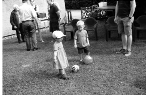
Ballspielen verkürzt die Zeit