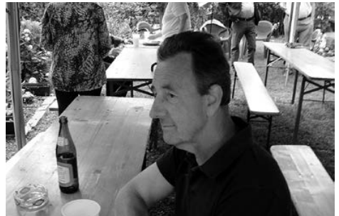
Warten auf die Köstlichkeiten